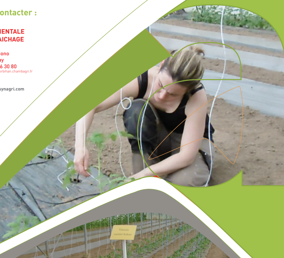
Témoin variété Kakao